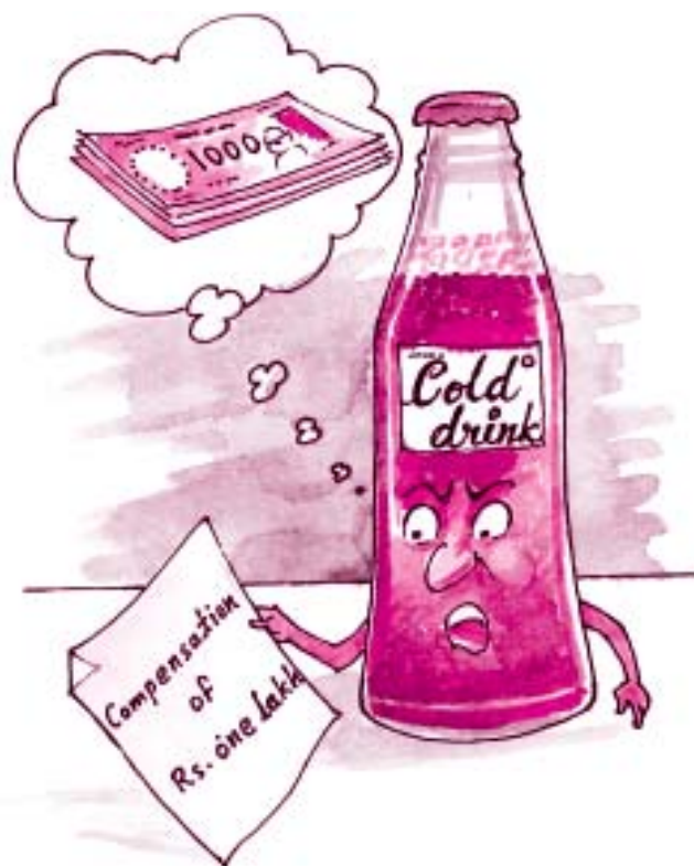
शीतल पेय में अशुद्धता के लिए हर्जाना