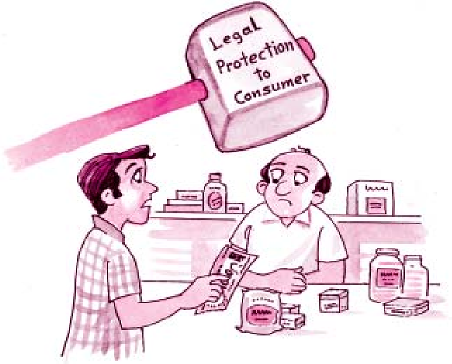
कदाचार एवं शोषण के विरुद्ध संरक्षण

करता है। यह अधिनियम उपभोक्ताओं को दोषपूर्ण वस्तुओं, घटिया स्तर की सेवाओं, अनुचित व्यापार क्रियाओं तथा अन्य प्रकार के शोषण के विरुद्ध सुरक्षा प्रदान करता है। इस अधिनियम के अंतर्गत तीन स्तरीय तंत्र की स्थापना का प्रवधान है जिसमें जिला फोरम, राज्य कमीशन एवं राष्ट्रीय कमीशन सम्मिलित हैं। इसमें प्रत्येक जिला, राज्य एवं सर्वोच्च स्तर पर उपभोक्ता संरक्षण परिषदों के गठन का प्रावधान है।